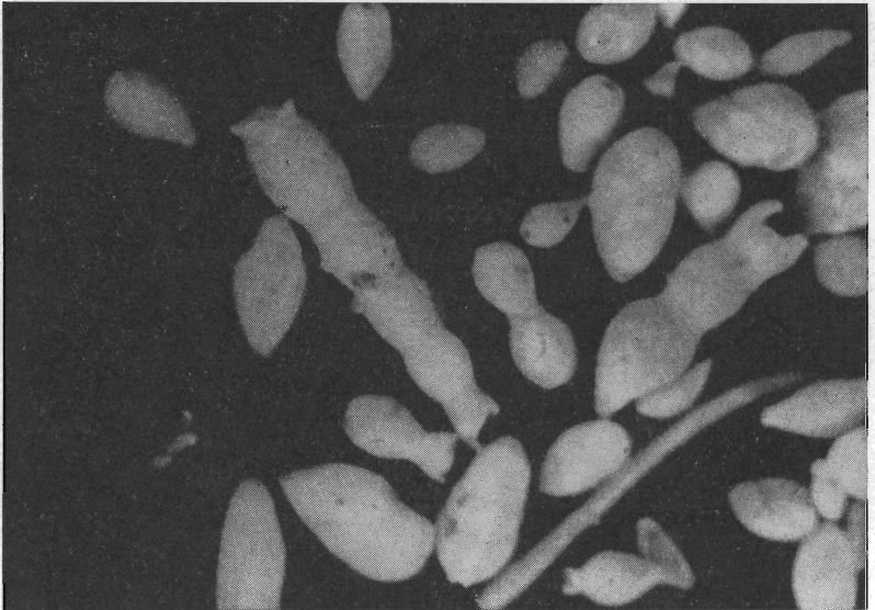
Abb. 2. Übersichtsaufnahme der Probe E 1 -73 mit Nodosaria sp.