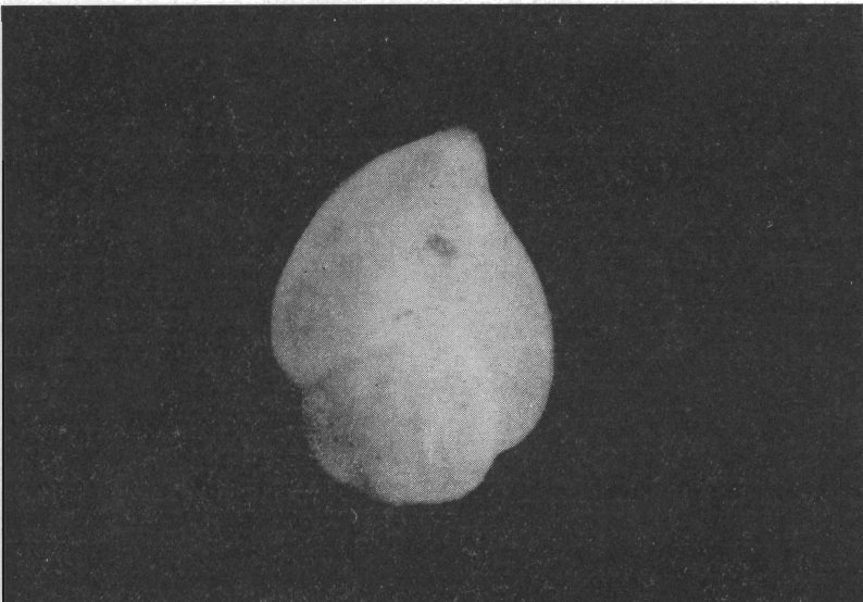
Abb. 4. Sigmorphina regularis (ROEMER) aus Probe Bö. 1.1