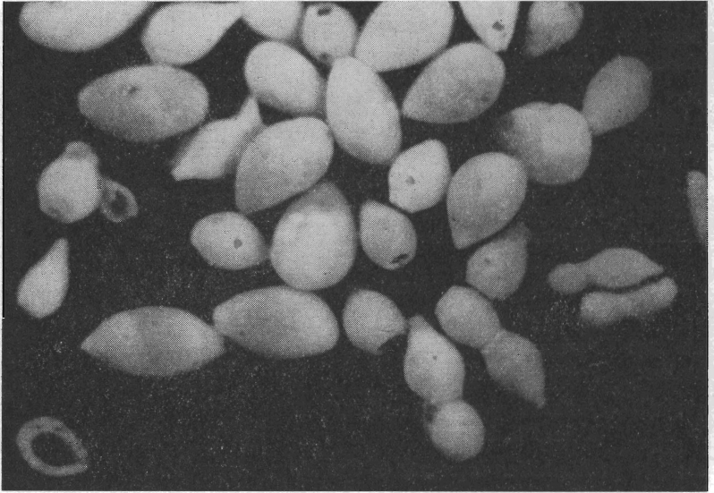
Abb. 1. Übersichtsaufnahme der Probe B 5 1.2 mit Guttulina problema (D'ORB.)