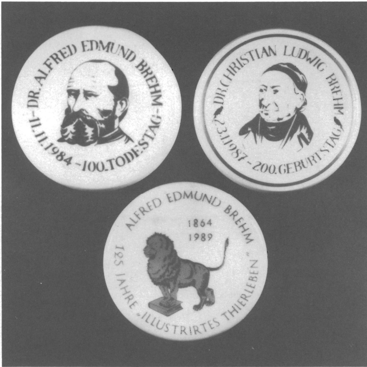
Abb. 12. Renthendorf, BREHM-Gedenkstätte. Porzellanplaketten 1984, 1987, 1989. Zu Teil 3.4, Pos. 6, 8, 9