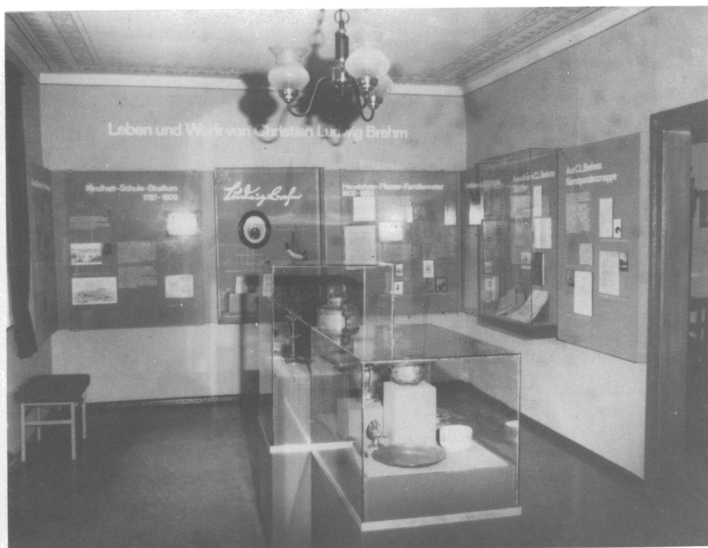
Abb. 7. Renthendorf. BREHM-Gedenkstätte. Ausstellungsraum zu C. L. BREHM, Neueinrichtung 1987. Zu Teil 3.2, Pos. 11