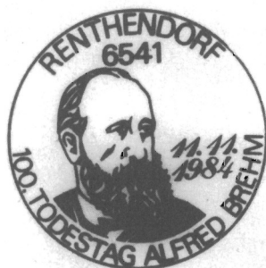
Abb. 10. Örtliche Poststelle 6541 Renthendorf, Sonderstempel zur A.-E.-BREHM-Ehrung 1984. Zu Teil 3.4, Pos. 5

Sonderstempel anlässlich des 100. Todestages von A. E. BREHM mit Porträt 45) , Einsatz 11. 11. 1984, auch in einem Sonderpostamt bei der Tagungsstätte der Gedenkveranstaltung, siehe Teil 3.1, (26)