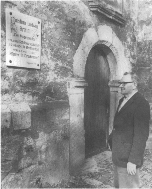
Abb. 1. Drackendorf, Kirche. Gedenktafel 1987 für C. L. BREHM und ihr geistiger Urheber KURT VOIGT. Zu Teil 1, Pos. 22