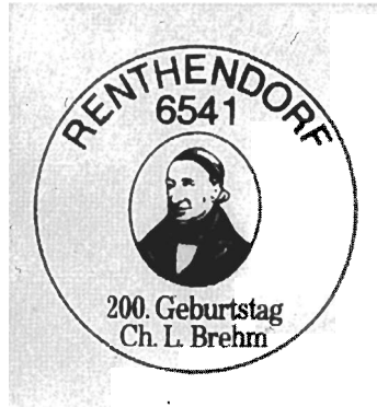
Abb. 11. Örtliche Poststelle 6541 Renthendorf, Sonderstempel zur C.-L.-BREHM-Ehrung 1987. Zu Teil 3.4, Pos. 7

Sonderstempel anlässlich des 200. Geburtstages von C. L. BREHM mit Porträt 46) , Einsatzzeit 24. 1. bis 25. 4. 1987