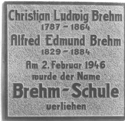
Abb. 4. Renthendorf, BREHM-Oberschule, Gedenktafel 1984. Zu Teil 1. Pos. 26

CHRISTIAN LUDWIG BREHM 1787–1864 ALFRED EDMUND BREHM 1829–1884 Am 2. Februar 1946 17) wurde der Name BREHM-Schule verliehen 18)