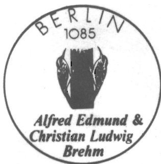
Abb. 9. Zentrales Postamt Berlin 1085, Sonderstempel zum Briefmarkenblock 1989. Zu Teil 3.4, Pos. 4

Sonderstempel zur 14. DDR-Emission, siehe (3), Einsatz 13. 6. bis 12. 8. 1989 43) . In Stempelmitte zwei Baumläufer an einem Stamm 44)