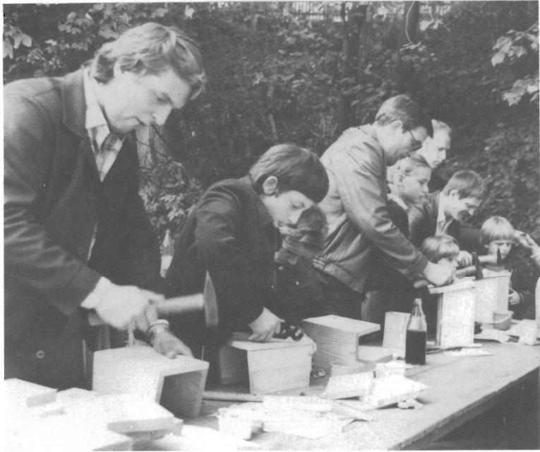
Abb. 6. Renthendorf, Pfarrhof. Nistkastenbau der Teilnehmer beim kirchlichen A.-E.-BREHM-Gedenken 1984. Zu Teil 3.1, Pos. 25

(27) Rat der Gemeinde und BREHM-Gedenkstätte 1986 Lichtbildervortrag wie (11), Erstaufführung, 13. 11. 1986