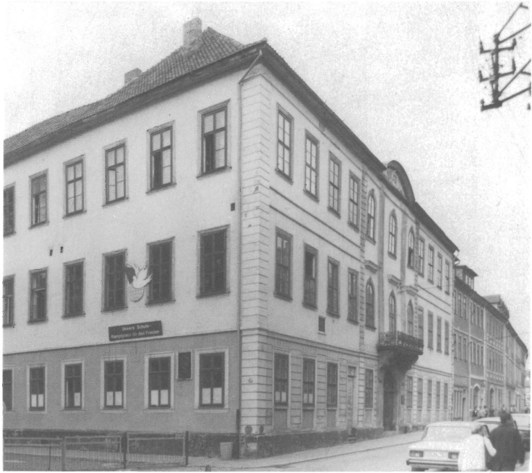
Abb. 2. Hildburghausen, Oberschule „JOSEPH MEYER“ 1987. Sitz des Bibliographischen Institutes 1828–1873. Zu Teil 1, Pos. 23