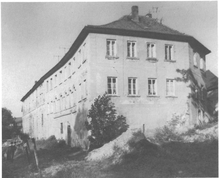
Abb. 3. Lausnitz, VON STEIN'Sches Rittergut im Verfall 1986. Wirkungsstätte C. L. BREHMS 1809–1812. Zu Teil 1, Pos. 25