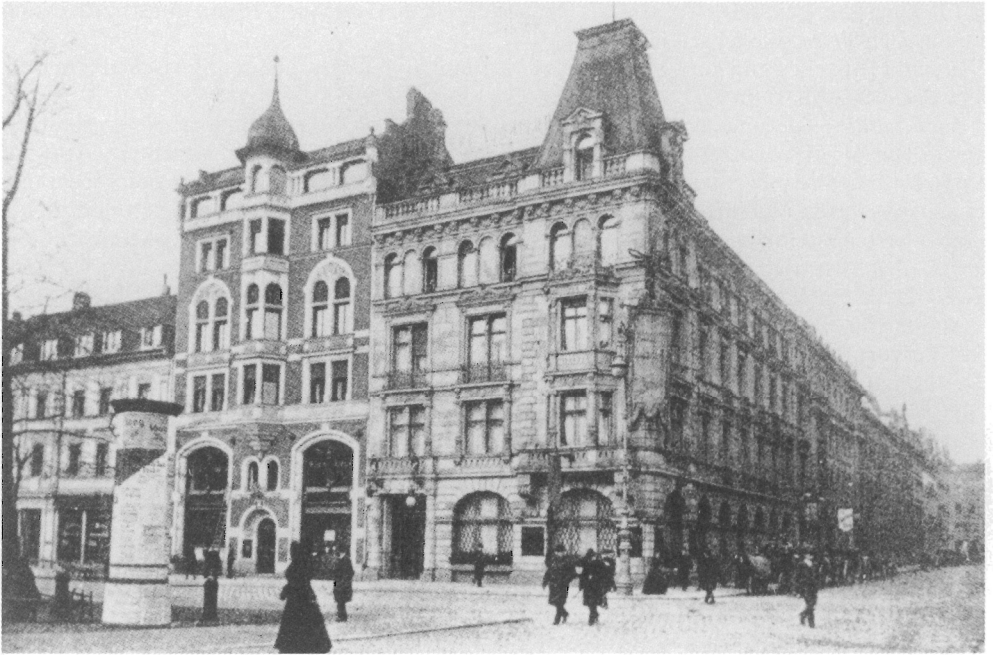
Abb. 2. Vorderhaus des „Berliner Aquariums“ Ecke Schadowstraße/Unter den Linden.