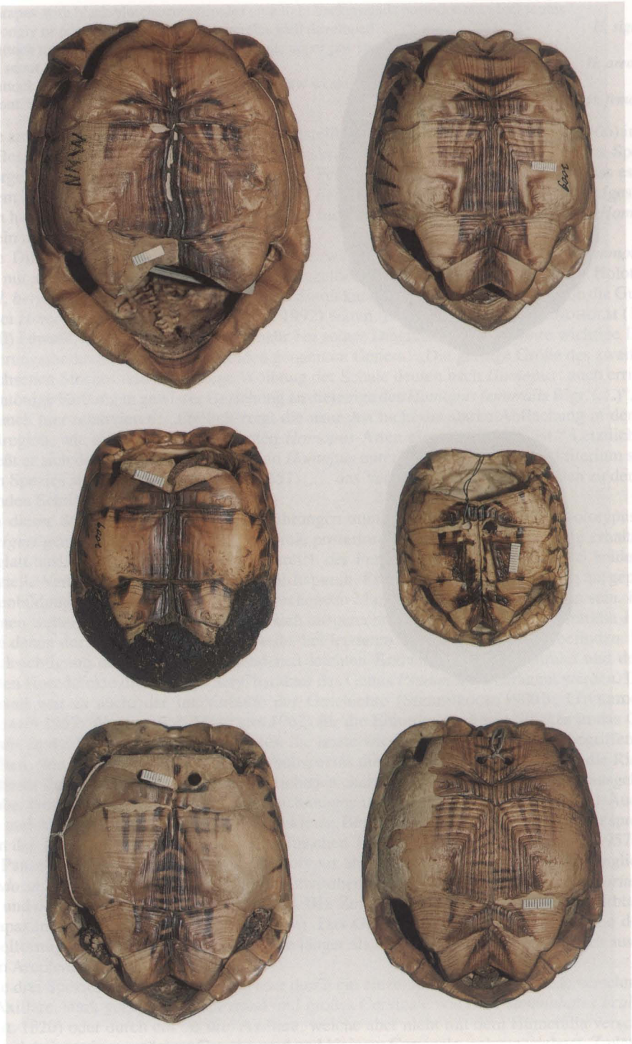
Tafel II. Wie Tafel I, Plastronansichten.