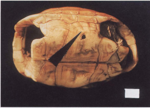
Abb. 1. Holotypus von Homopus bergeri mit deutlichen Resten von Strahlenzeichnungen im Brückenbereich. Maßstab 1 cm.

Die Grundfarbe ist fast einheitlich horn gelb bis bernsteinfarben. Nur im Brückenbereich sind geringe Reste der Strahlenzeichnung schwach ausgebildet (Abb. 1).