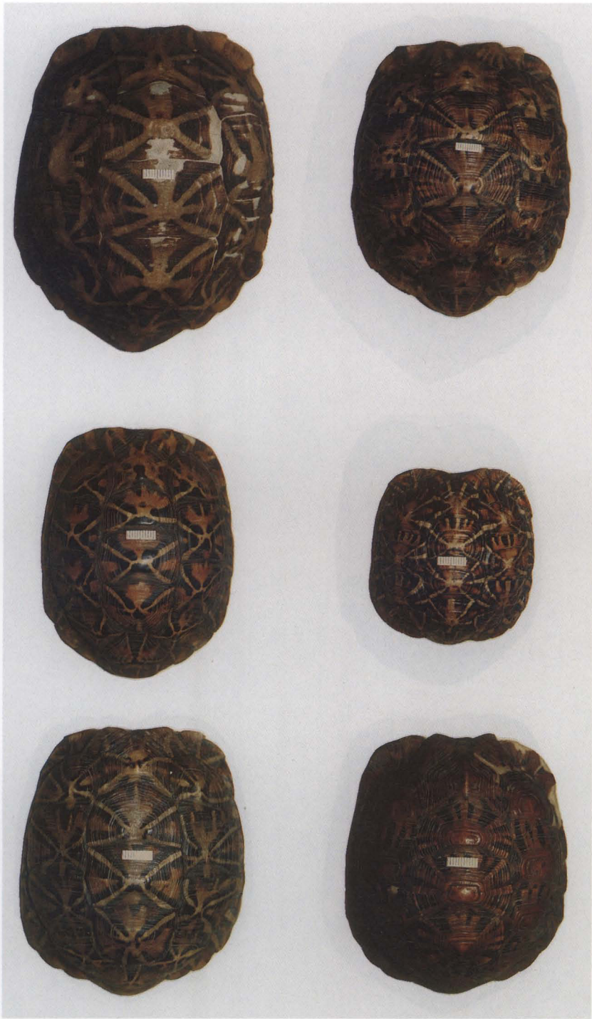
Tafel I. Psammobates tentorius verroxii , Carapaxansichten des Materials aus dem Museum Wiesbaden mit typischer Zeichnung und Färbung.

Psammobates tentorius verroxii (Müller) - Psammobates tentorius verroxii (Müller) - Psammobates tentorius verroxii (Müller) - Psammobates tentorius verroxii (Müller) - Psammobates tentorius verroxii (Müller) - Psammobates tentorius verroxii (Müller)