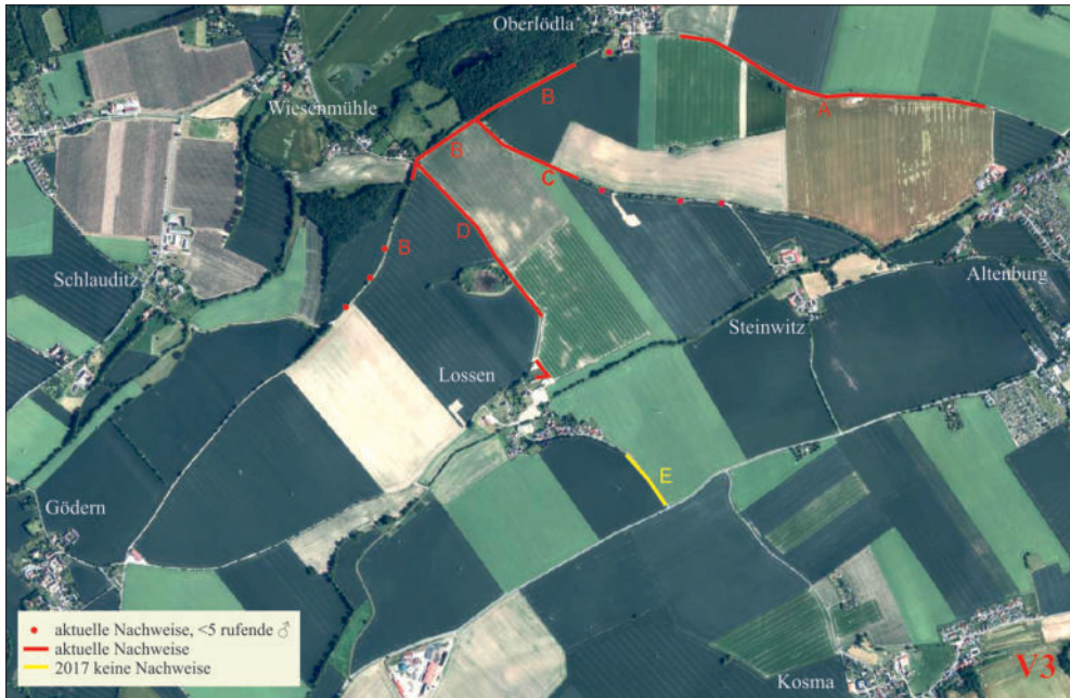
Abb. 7: Ch. apricarius -Vorkommen zwischen Altenburg–Lödla–Lossen–Steinwitz (V6), Karte: www.geoportal-th.de , verändert.