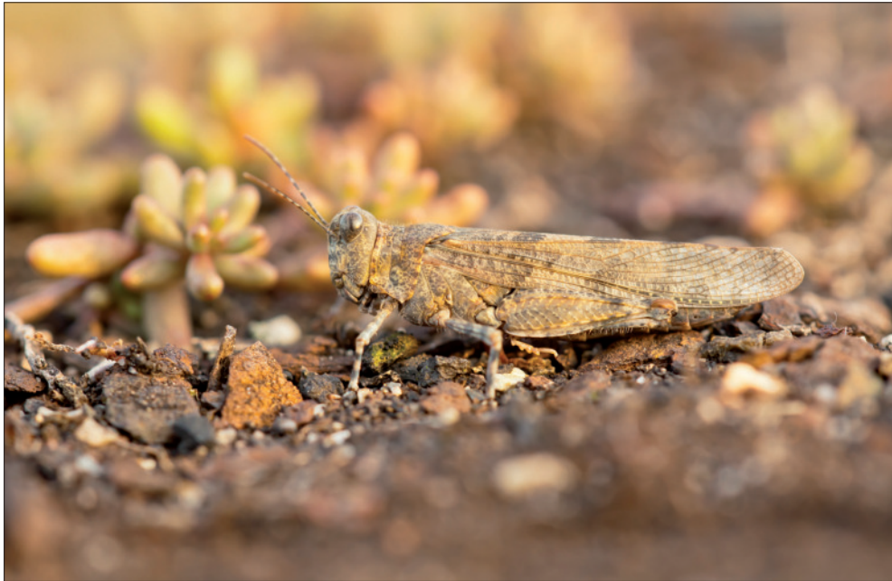
Abb. 6: Blauflügelige Sandschrecke ( Sphingonotus caerulans) auf dem Gelände der Bahnbrache Plagwitz, aufgenommen im Bereich der freiliegenden alten Gleise.