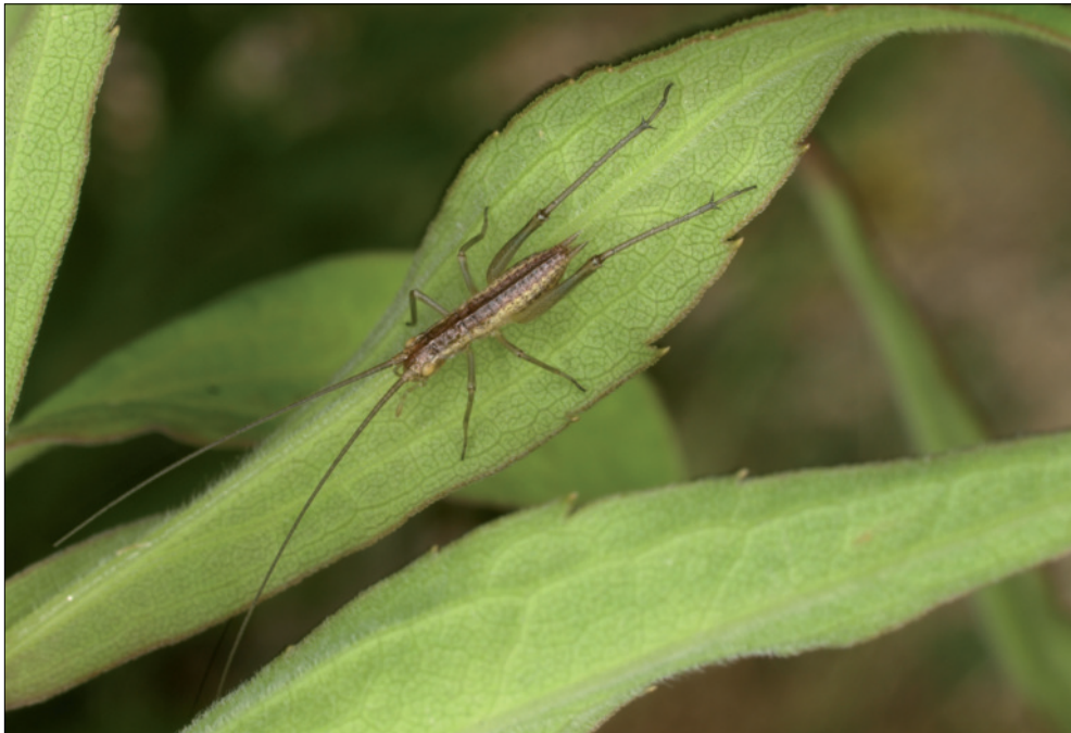
Abb. 4: Jüngerer Larvenstadium des Weinhähnchens. Zeitgleich waren auch bereits weiter entwickelte Tiere mit deutlich sichtbaren Flügelanlagen anzutreffen, die bereits im Juni geschlüpft sein dürften.

Mit der Keschermethode konnten im Juli 2013 zahlreiche Individuen nachgewiesen werden. Durch den gewählten Zeitpunkt bedingt, handelte es sich überwiegend um Larven (Abb. 4). Diese stichprobenhafte Erfassung von 74 Exemplaren auf einer Teilfläche von etwa 0,66 ha lässt zumindest vermuten, dass sich in diesem Jahr die Populationsdichte auf der Gesamtfläche in einem dreistelligen Bereich bewegte.