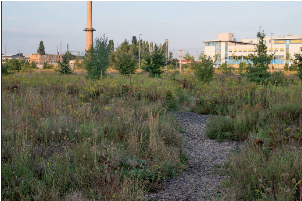
Abb. 2: Teilansicht des brachgefallenen Güterbahnhofgeländes in Plagwitz. Die hier vorkommenden Weinhähnchen halten sich in der höherwüchsigen Vegetation der Kraut- und Strauchschicht auf.

Auf den offenen Flächen mit Kiesuntergrund dominiert lokal die Weiße Fetthenne ( Sedum album ) und die einjährigen Ruderalfluren werden – zumindest an einigen Standorten – durch das Kanadische Berufkraut ( Conyza canadensis ) bestimmt.