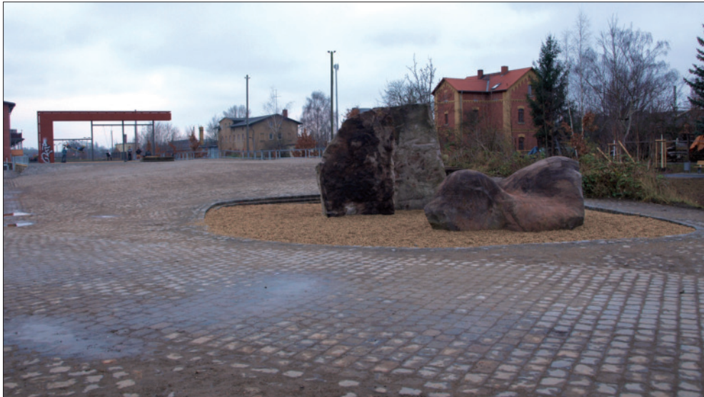
Abb. 7: Erste Ausbaustufe des Bürgerbahnhofs: ein kleiner Kletterfelsen und eine Luftschaukel im Nordbereich des ehemaligen Güterbahnhofs.