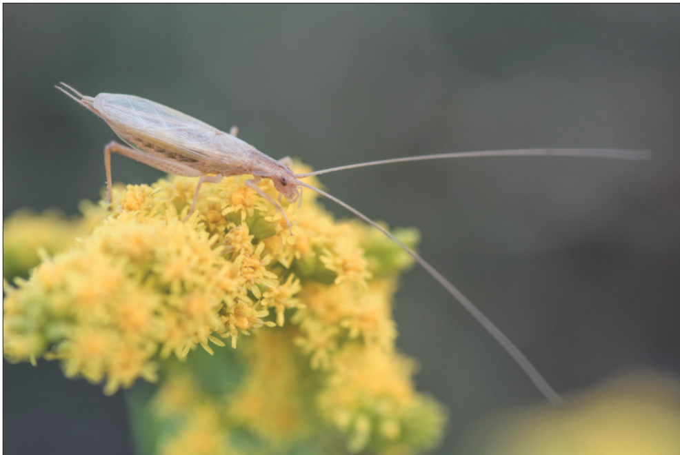
Abb. 5: Ein Männchen des Weinhähnchens auf dem Blütenstand einer Goldrute ( Solidago spec.).