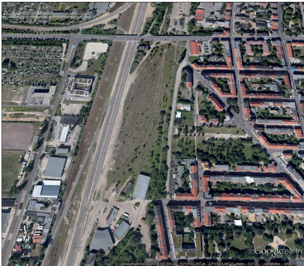
Abb. 1: Luftbildaufnahme des Fundgebietes vom 14.08.2012. Die für das Weinhähnchen derzeit potentiell besiedelbare Fläche dürfte etwa 4 ha betragen (d.h. vorhandene weitestgehend vegetationsfreie Bereiche und dichtere Gehölzbestände bleiben unberücksichtigt).

Anhand der Nutzung, der Substratbeschaffenheit und der (aktuell) vorhandenen Vegetation wurden im Jahre 2012 verschiedene Flächentypen klassifiziert. Für den hier interessierenden Südteil ergeben sich folgende Anteile: Schotterflächen (0,24 ha), Bereiche mit rückgebauten