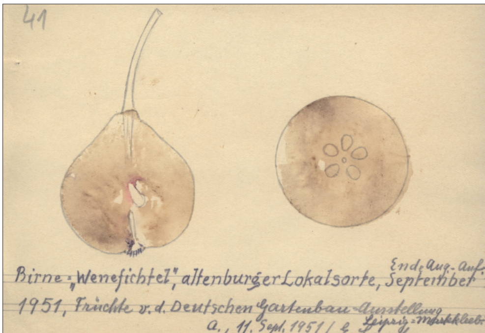
Abb. 2: Wenefichtel, Zettelkatlog SANTE (1949–1953). Archiv Naturkundliches Museum Mauritianum Altenburg.