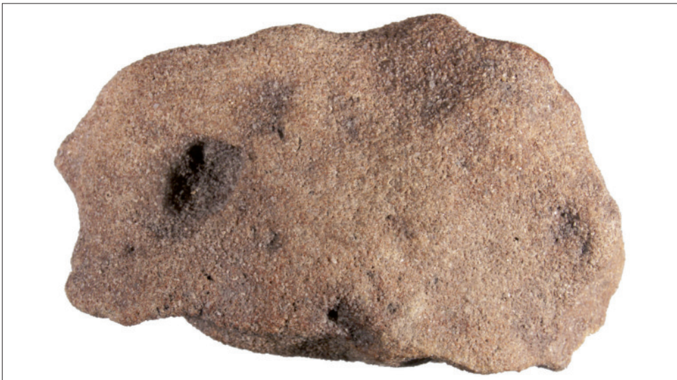
Abb. 1: Sandbernstein aus dem Braunkohlentagebau Schlabendorf-Süd (Lausitz). Länge des Stücks 81 mm.

Das Untersuchungsmaterial wird im Naturkundlichen Museum Mauritianum Altenburg hinterlegt.