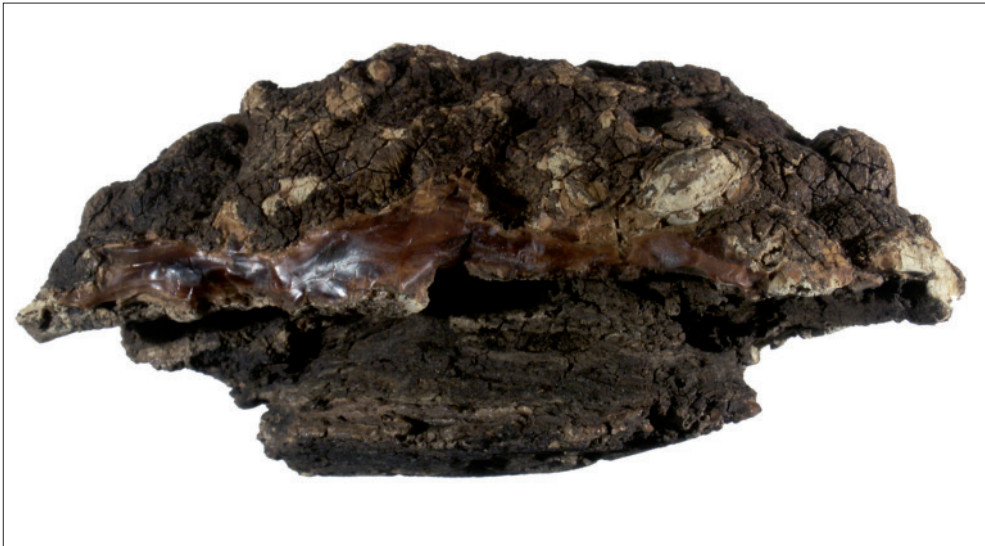
Abb. 2: Rindenharzgalle aus der Braunkohle des Tagebaues Mücheln-Süd (Geiseltal). Länge des Stücks 117 mm.